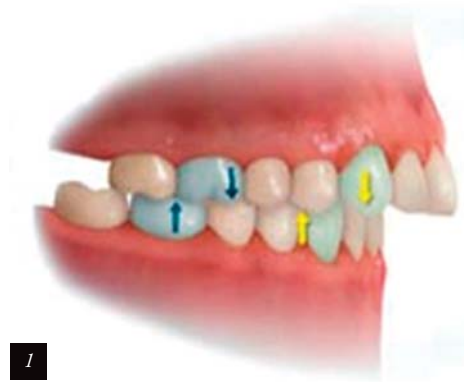
Fig. 1: Relación molar de clase II

En la actualidad, una de las áreas más controvertidas en el diagnóstico ortodóncico y la planificación del tratamiento es la relación entre la obstrucción de las vías aéreas